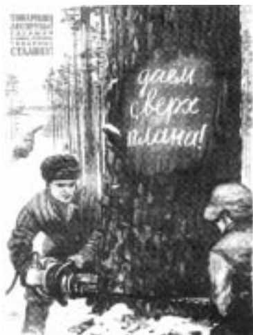
РИСУНОК С САЙТА FISHKINET